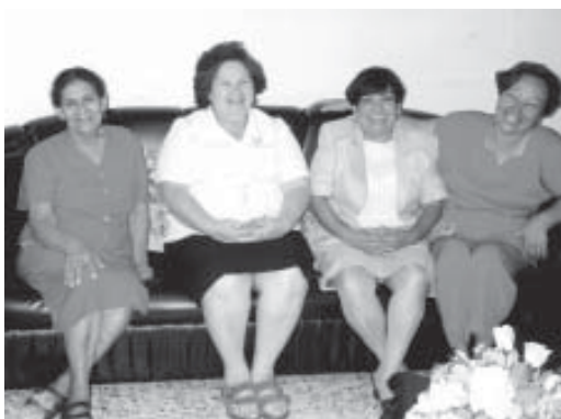
Intusiastas hermanas hondureñas.

muladas por los equipos infanto-juveniles. En el intercambio de ideas los hermanos hondureños se quejaron con razón, diciendo que hacía 25 años que no les visitaban oradores de otros países. Compartieron con estos hermanos llevando el mensaje de Amor y de Esperanza de la Doctrina Espírita. A la reunión en las formidables instalaciones de esta Institución asistieron unas 200 personas.