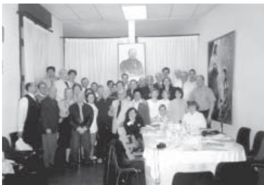
Grupo de los asistentes a las reuniones del C.E.I. Europa en el Centro de Estudios y Divulgación Espírita de Madrid, el día 4 de abril de 1999.

Fueron días de grata convivencia y trabajo que sirvieron para propiciar el