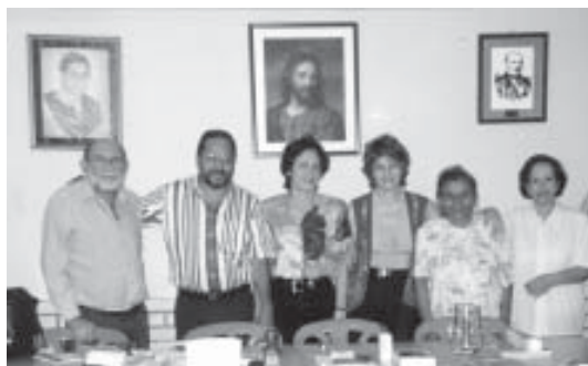
Directivos del Centro Espírita Sócrates