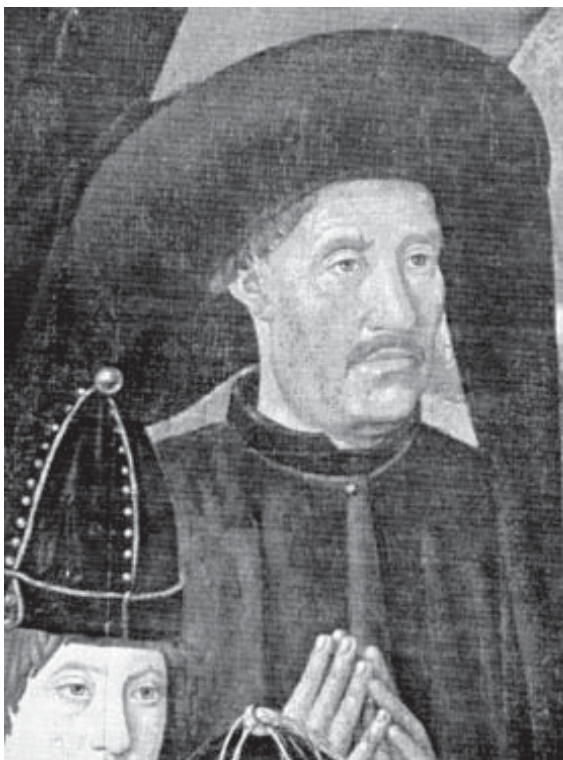
Infante D. Henrique de Sagres. Cuadro de Nuno Gonçalves. (Museo de Arte Antigo, Lisboa)

“ – Para esta tierra maravillosa y bendita será transplantado el árbol de mi Evangelio de piedad y de amor. En su suelo dadivoso y fértilísimo, todos los pueblos de