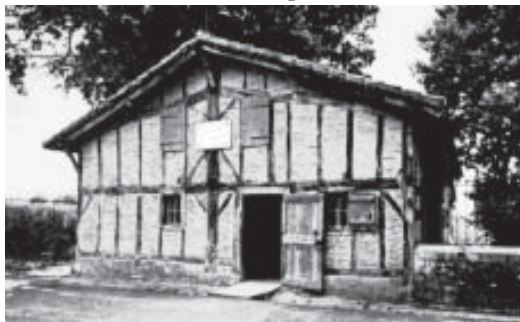
Casa natal de Vicente de Paúl em Pouy (Dax).

La última enfermedad puede decirse que comenzó en 1656. Se le declararon unas fiebres altísimas y la inflamación de las piernas llegó hasta las rodillas. Se recobró lo suficiente para retornar al trabajo, pero, ya nunca más se puso bien del todo. Las fiebres eran cada vez más frecuentes, perdió el apetito, sobre todo durante una cuaresma, que pasó casi sin probar bocado de cualquier cosa, y la inflamación de las piernas se hizo permanente. Para cúmulo de males, a comienzos de 1658 tuvo un accidente. Un día, al regresar de París, se rompió un muelle de la carroza, esta se cayó de un lado, y Vicente sufrió un fuerte golpe en la cabeza. Pocos meses más tarde, se presentó una nueva complicación: se le enfermó un