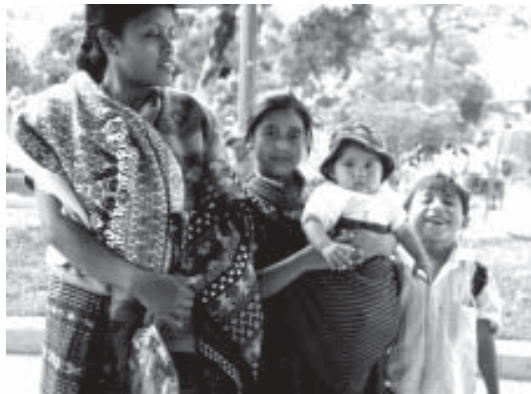
Familia indígena guatemalteca