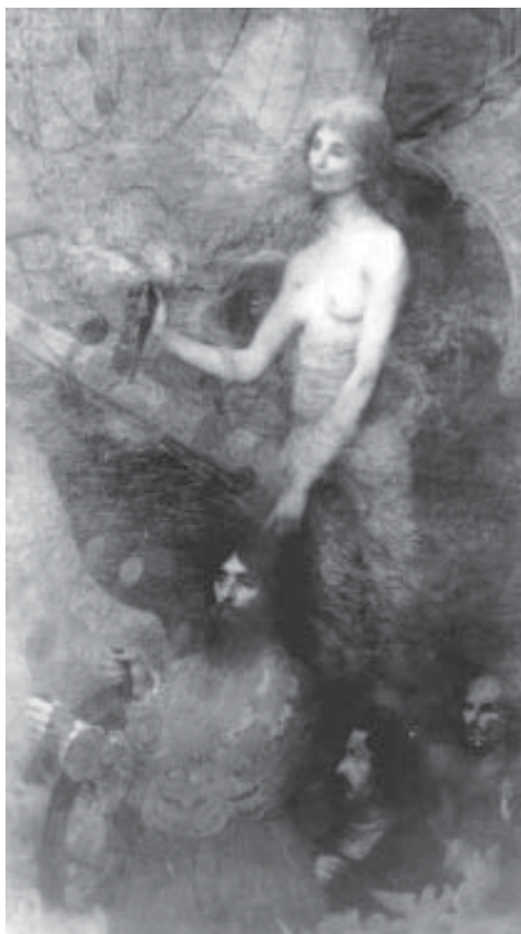
La inspirada pintura La Providencia Guía a Cabral , 1899, de Eliseu Visconti. (Pinacoteca del Estado, São Paulo) "El simbolismo que domina la obra, proyecta como en un primer plano, rodeado por dos personajes, el timón en las manos y encima grandes velas sugiriendo las naves, y la presencia etérea de la Providencia iluminando (con la antorcha) el camino del descubridor." El segundo plano está constituido por el mar infinito, bajo la suave iluminación de la aurora.

En el extenso océano, el capitán mayor considera la posibilidad de llevar su bandera a la tierra desconocida del hemisferio sur. Su deseo crea la necesaria ambientación al gran plan del mundo invisible. Henrique Sagres aprovecha esta maravillosa posibilidad. Sus falanges de navegantes del Infinito se desdoblaron en las carabelas embanderadas y alegres. Se aprovechan todos los ascendientes mediúmnicos. Las noches de Cabral son pobladas de sueños sobrenaturales e insensiblemente, las inquietas carabelas ceden al impulso de una orientación imperceptible. Los caminos de las Indias son abandonados. En todos los corazones hay una angustiosa expectativa. El pavor a lo desconocido domina el alma de aquellos hombres rudos, que se